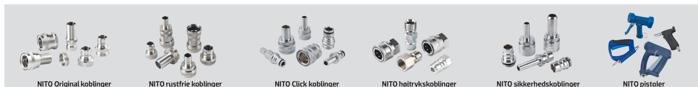
NITO Original koblinger