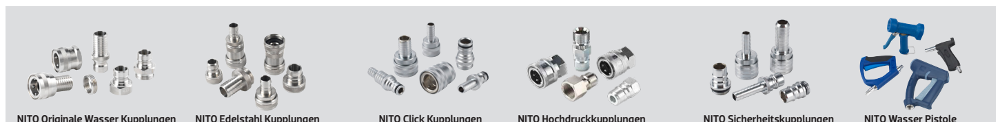
NITO Originale Wasser Kupplungen