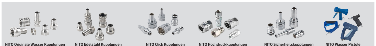
NITO Originale Wasser Kupplungen