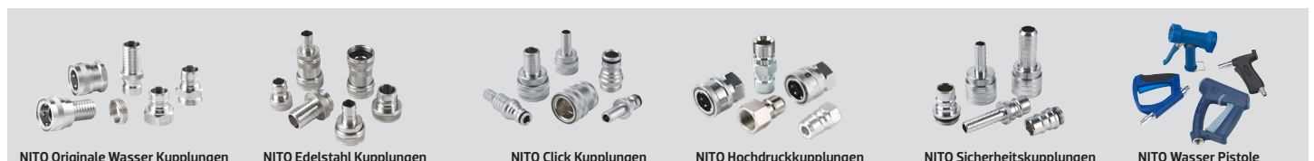
NITO Originale Wasser Kupplungen