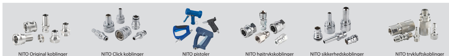
NITO Original koblinger